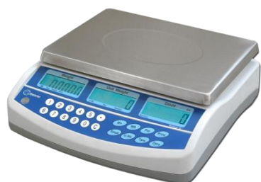
BILANCIA CONTAPEZZI SERIE BCP E BCD Piece counter BCP and BCD series