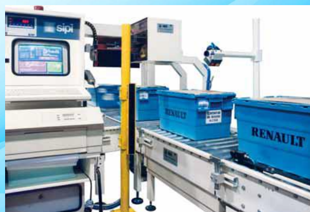
Fine linea per la preparazione e l'evasione degli ordini di parti di ricambio per il settore automotive.

Inside conveying line with parcel packing, and automatic box making.