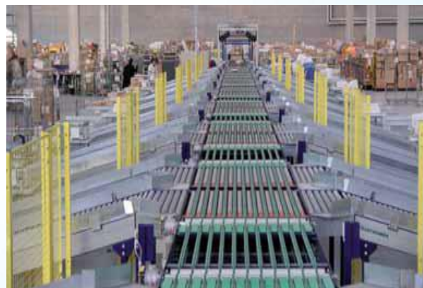
Impianto automatico di handling and sorting predisposto per l'identificazione dei colli, la rilevazione del peso e del volume e la destinazione in 32 baie di scarico.

Line for identifying and selecting covers, envelopes and parcels.