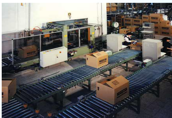
Linea di trasporto interno ed imballaggio di scatole con formatura automatica dei colli.

Automatic "handling and sorting" system for parcel identification, weight and volume acquisition, destination to 32 unloading bays.