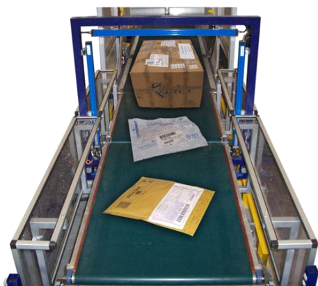
Linea per l'identificazione e la selezione automatica di plichi, buste e pacchi.

Sipi achieves the total integrated automation of the order and shipment execution process, with procedures that go from withdrawing goods from stock to loading them on trucks. Sipi End of line systems provides for parcel handling and packing, integration with data management and interface with host computer.