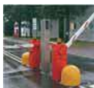
Controllo accesso automezzi e/o dipendenti. Access control for vehicle / employees.