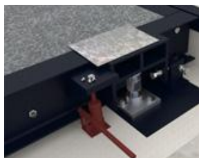
Cella di carico. Load cell unit.

Platform for motor vehicles built in metal or prefabricated cement.