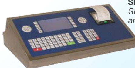
SE 500 I Plus Inox Grafico SE 500 I Plus stainless steel and graphic display.