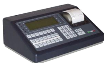
SE 511 AN-4R ST display LCD SE 511 AN-4R ST LCD Display