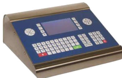
SE 500 AN Inox Grafico SE 500 AN Stainless steel version and graphic display