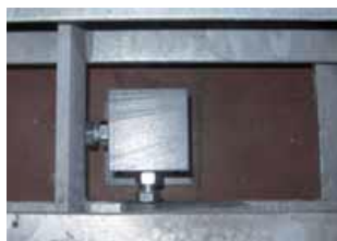
Limitatore oscillazioni. Oscillation limiting device.