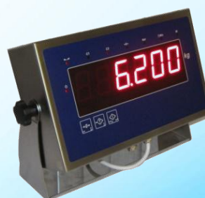
RIPETITORE SE 308 Inox Display H45 – IP 65 SE 308 I Repeater H45 Display – IP 65