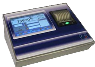
SE 500 TS AN ST Touch Screen SE 500 TS AN ST Touch Screen