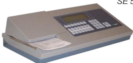
SE 511 AN-M-C SE 511 AN-M-C