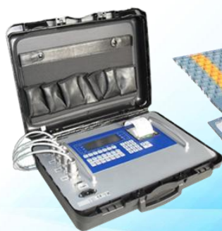
Indicatore di pesatura mobile. Mobile weighing indicator.