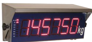
RIPETITORE SE 308 Inox Display H100 – IP 65 SE 308 I Repeater Stainless steel version H100 Display – IP 65