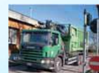
Sbarre di controllo Accessi. Access control bars.