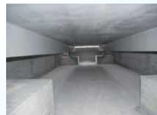
Particolare fondazione. Foundation detail.