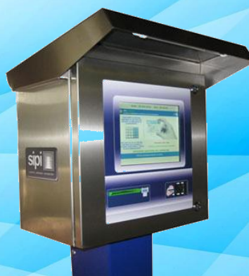
SIPI SERIE SISCO Gestione isole ecologiche SIPI SISCO SERIES Management ecological islands.