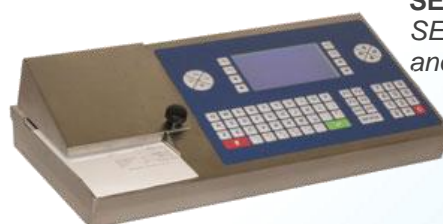
SE 500 I M290 Inox Grafico SE 500 I M290 stainless steel and graphic display