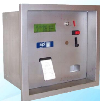
SE 511 SS Self Service SE 511 SS Self Service