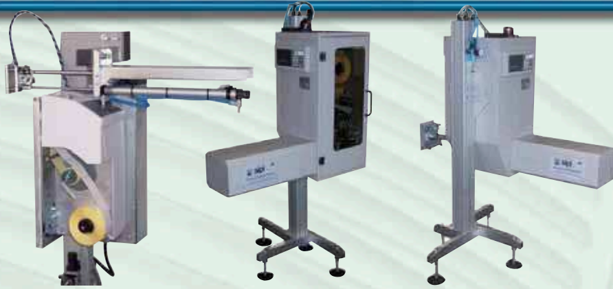
Etichettatore standard con un movimento lineare per etichette 4" e 6" con applicazione a contatto. Standard labelling system with linear movement, for 4" and 6" labels - Contact application model.