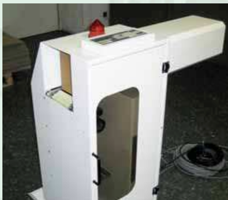
Etichettatore per linea di movimentazione scatole Labelling system for boxes handling line