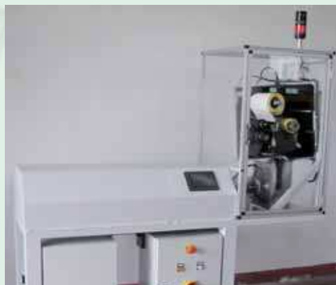
Etichettatore per etichette di dimensioni A4 con verifica del codice a barre applicato. Labelling system for A4 labels, with check of the barcode applied