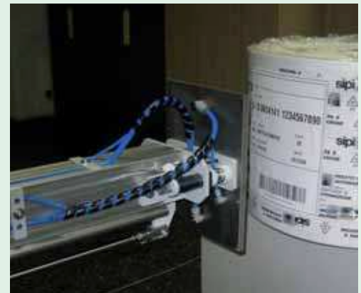
Particolare del sistema di applicazione "a soffio d'aria" per superfici curve Particular of the "air-puff" application system for curved surfaces