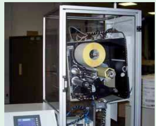
Particolare del gruppo di stampa delle etichette in formato A4. Particular of the printer for A4 labels