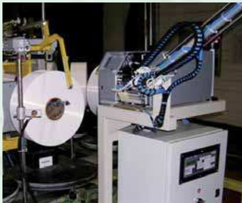
Sistema ETICONO per l'applicazione di etichette all'interno dell'anima di bobine, rocche ecc. "ETICONO" System for applying labels inside bobbins, reels etc.