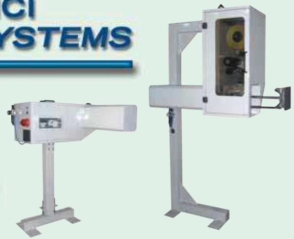
Etichettatore standard con un movimento lineare per etichette 4" e 6" e applicazione dell'etichetta "a soffio d'aria". Standard labelling system with linear movement, for 4" and 6" labels - "Air-puff" model.