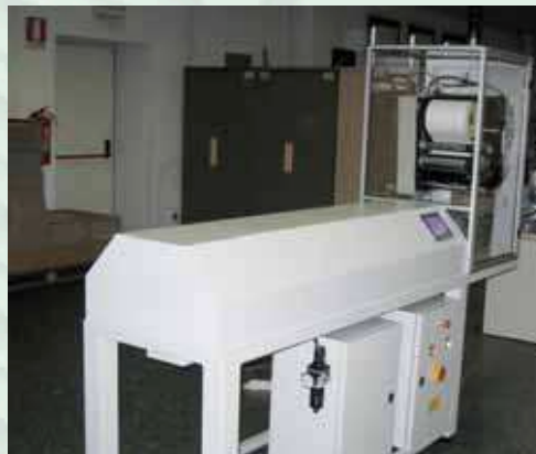
Etichettatore per l'applicazione automatica dell'etichetta con cilindri telescopici e corsa sino a 1500 mm, con verifica del codice a barre applicato. Labelling system for applying labels with a telescopic cylinder - stroke up to 1500 mm - check of the barcode applied