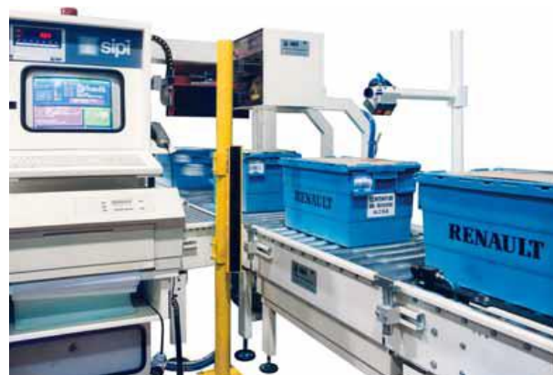
Fine linea per la preparazione e l'evasione degli ordini di parti di ricambio per il settore automotive.

Inside conveying line with parcel packing, and automatic box making.